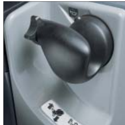
Bedienmodul: Fahren und Hydraulik