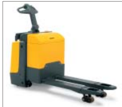
Robust durch Prallschutz und Zugstangenkinematik