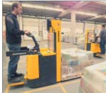
Ausstapeln mit dem ERC

Alle Hub-/Senkfunktionen werden bequem und ohne Umgreifen vom Deichselkopf aus gesteuert. Die Jungheinrich-Proportionalhydraulik ermöglicht dabei die feinfühligste Steuerung der Hub- und der Senkgeschwindigkeit – wichtig für das exakte, sanfte Absetzen der Last im Regal oder das exakte Positionieren der Last beim Ein-/Ausstapeln. Bei engen Platzverhältnissen werden Standplattform und Seitenschutz einfach eingeklappt und der ERC wird als Mitgängerfahrzeug eingesetzt. Die geringe Höhe der Plattform sichert dabei einen leichten Auf-/Abstieg.