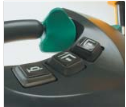
Taster für feinfühliges Heben und Senken, sowie Hupen

Jungheinrich-ProTrac optimiert die Traktion des Antriebsrades. Ein Federdämpfersystem im Stützrad verhindert bei unebenen Bodenverhältnissen ein Durchrutschen des Antriebsrades. Beim Ein-/Ausstapeln bietet ProTrac festen Stand auf allen vier Rädern durch die hydraulische Arretierung des Stützrades ab 1800 mm Hubhöhe.