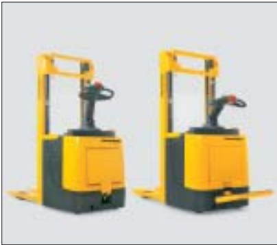
ERC 212 mit hoch-/heruntergeklappter Standplattform