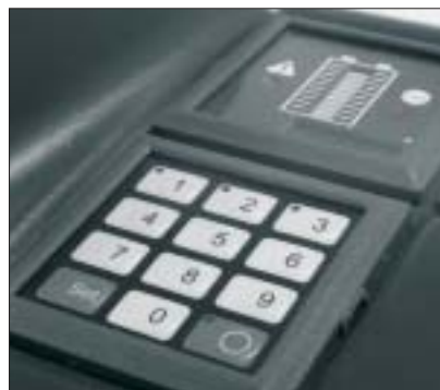
Jungheinrich-CanCode a CanDis (volitelné vybavení)