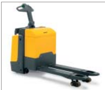
Robustní díky ochraně před nárazy a táhlové kinematice